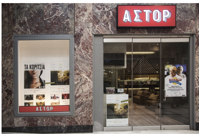
Σημερινή είσοδος κινηματογράφου ΑΣΤΟΡ