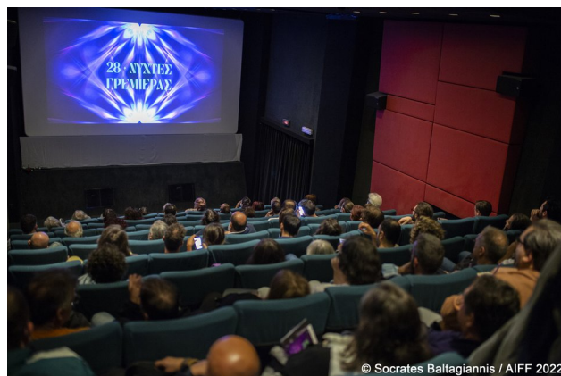
Εσωτερική όψη κινηματογράφου ΆΣΤΟΡ κατά τη διάρκεια προβολής του Διεθνούς Φεστιβάλ Κινηματογράφου της Αθήνας-Νύχτες Πρεμιέρας

Σήμερα, το ΆΣΤΟΡ αποτελεί έναν από τους λίγους κλειστούς (χειμερινούς) κινηματογράφους που παραμένουν σε λειτουργία στο κέντρο της Αθήνας. Εντάσσεται στο σύνολο των ιστορικών κινηματογράφων της Αθήνας, και μάλιστα, γειτνιάζει με τους επίσης ιστορικούς, με διατηρητέα χρήση, κινηματογράφους «ΑΣΤΥ», «ΑΤΤΙΚΟΝ» και «ΑΠΟΛΛΩΝ». Οι 2 τελευταίοι, υπέστησαν καταστροφή από πυρκαγιά (2012) και έκτοτε έχουν διακόψει τη λειτουργία τους.