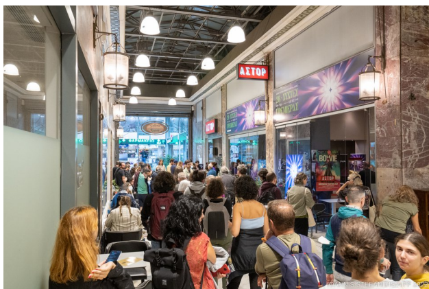
Εξωτερική όψη κινηματογράφου ΆΣΤΟΡ από τη Στοά Κοραή κατά τη διάρκεια του Διεθνούς Φεστιβάλ Κινηματογράφου της Αθήνας-Νύχτες Πρεμιέρας

Το ΆΣΤΟΡ βρίσκεται στην καρδιά του κέντρου της Αθήνας, σε επικοινωνία με τη Στοά Κοραή όπου γίνεται σήμερα η είσοδος στον κινηματογράφο αλλά και με την οδό Σταδίου (όπου υπήρξε η εμβληματική είσοδος του κινηματογράφου στο παρελθόν). Αναφέρεται πως δίνει ζωή σε αυτό το κεντρικό σημείο της πόλης και τις βραδινές ώρες, ιδιαίτερα εντός της Στοάς Κοραή, όπου τα καταστήματα εστίασης προσαρμόζουν τη λειτουργία τους στο πρόγραμμα του κινηματογράφου.