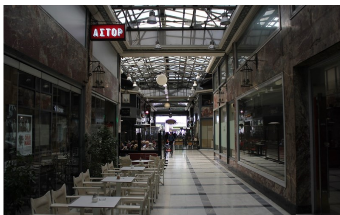
Θέση Κινηματογράφου ΑΣΤΟΡ εντός της Στοάς Κοραή