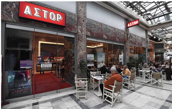
Εξωτερική όψη φουαγιέ κινηματογράφου ΑΣΤΟΡ από τη Στοά Κοραή

Πριν την έναρξη προβολής των ταινιών, οι θεατές μπορούν να βιώσουν την «εμπειρία του φουαγιέ» το οποίο λειτουργεί ως χώρος κοινωνικοποίησης, όπου υπάρχει Κυλικείο-Μπαρ με τραπεζοκαθίσματα στον εξωτερικό χώρο του κτιρίου, επί της Στοάς Κοραή.