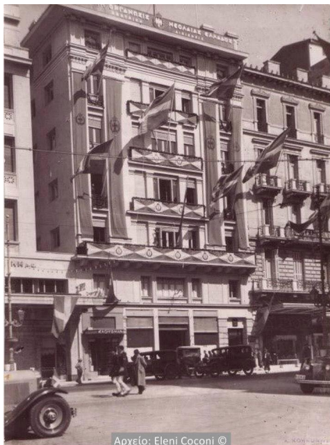
Μέγαρο Εφεσίου: Στο ισόγειο το Βιβλιοπωλείο Κάουφμαν και ο κινηματογράφος, την εποχή που ονομαζόταν Σινε Νιούζ