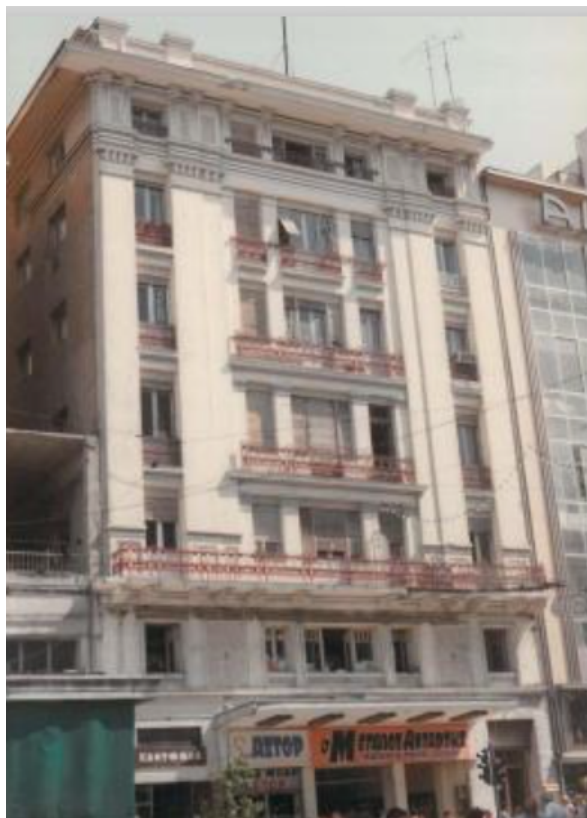
Η παλαιά είσοδος του κινηματογράφου επί της οδού Σταδίου