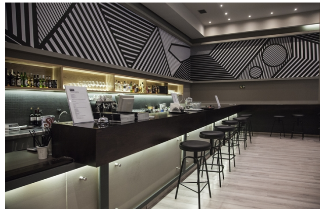
Εσωτερική όψη φουαγιέ κινηματογράφου ΑΣΤΟΡ

Το ΑΣΤΟΡ, πέραν της τακτικής λειτουργίας του ως κλειστός (χειμερινός) κινηματογράφος, φιλοξενεί και διάφορες εκδηλώσεις, όπως κινηματογραφικές προβολές στο πλαίσιο του Διεθνούς Φεστιβάλ Κινηματογράφου της Αθήνας «Νύχτες Πρεμιέρας» και άλλων Φεστιβάλ.